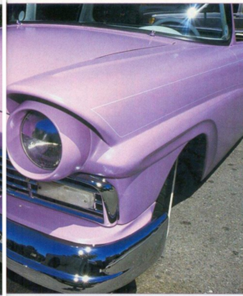
schermen zijn de lijnen van de Ranchero dramatisch gewijzigd.