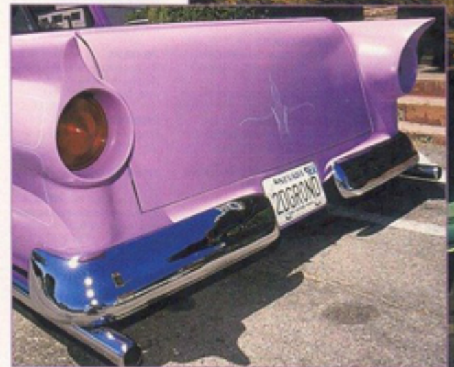
Mooie license plate: "To the ground."