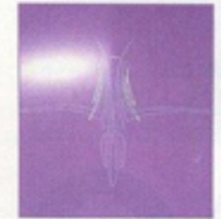
Fine lines: geen fifties custom is volledig zonder pinstriping.

Een dergelijke Ford Ranchero '57 zie je echt niet op elke straathoek. Wij weten het nog: in het eerste jaar verlieten 21 695 exemplaren de fabriekshallen. Chevrolet zou pas twee jaar later het idee opnemen en de El Camino in de wedstrijd brengen. Maar die is in de lowrider scene, zoals bekend overheerst door Chevy's, net zo'n exoot als deze Ranchero. De Impala is nog altijd onbetwist nummer 1. Onze tandarts echter, die in het Eldorado van de eenen twee-armige bandieten Las Vegas niet alleen tanden vult - we noemen hem maar Skip -, heeft de Ford reeds sinds 1981 in de garage staan. Toen hij onlangs door de lowrider-koorts werd gegrepen, besloot hij zijn sedan truck weg te doen. "150 dollar heb ik er toen voor betaald," herinnert de moderne folterknecht zich - die zijn familienaam niet wil prijsgeven (hij zal wel weten waarom). "In die tijd zag de kar er ook helemaal niet uit!" Wij verontschuldigen ons voor de misschien scherpe bewoordin-