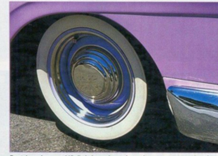
De stalen velgen van 14" zijn bekroond met chroomkappen van een oudere datum.

'57-lijn dramatisch benadrukt wordt. Daarop zaagde hij de twee bumpers weg, om hun uiteinden ergens anders te gebruiken. Op de grille na verwijderde hij alle chroomlijsten en emblemen. De overgebleven gaten werden opgevuld en gepolijst. Dat kon hij immers het beste. Over de lak wil Skip niet veel kwijt. Maar de basiskleur is ergens paars, gecombineerd met matte lak, wat een zeer opvallende primer-look geeft. Een plaatselijke specialist kreeg aansluitend de opdracht het interieur te overtrekken met wit leder en lila stof. Voor de uitbouw van zijn Ranchero moest Skip naast zijn eigen arbeid 6 000 dollar betalen. Dat doet een tandarts uit de kleine kassa.